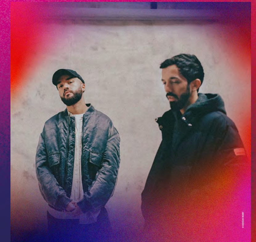
BIGFLO & OLİ